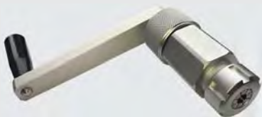
高压钢管加工工具